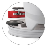
Tête et système d'essuyage en aluminium