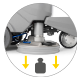
Pression au sol supplémentaire