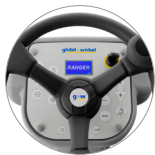
Commande panneau muni d'écran