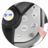
Fonction "Ready to go"