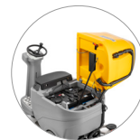
Accès facile à tous les composants