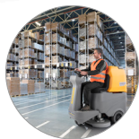
Ergonomie et confort