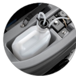
Chemical mixing system